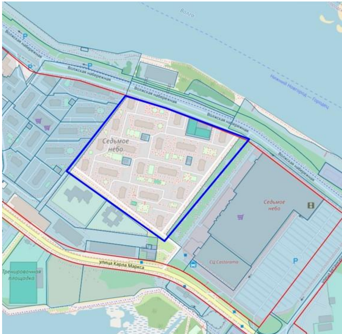
Схема границ подготовки документации по планировке территории